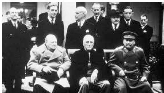
Sentados: Winston Churchill, Inglaterra; Franklin Roosevelt; EUA e Joseph Stalin; Rússia, em 1945.

mico brasileiro: "Brazil Takes Off" ("O Brasil decola"). Sobre a Organização das Nações Unidas - ONU: Ela foi criada em 1945, logo após o término da 2ª guerra mundial pelos vencedores Inglaterra, EUA e Rússia para garantir a paz mundial e de lambuja também garantiram acento permanente, com direito a veto, para França e China. No entanto, é sabido que até agora não impediram guerra alguma. O Brasil do General Eurico Gaspar Dutra, por ter sido o primeiro país a aderir à organização, garantiu o privilégio de presidir a Assembleia Geral, realizada anualmente na qual a presidente, na semana passada, protestou contra a espionagem dos EUA.