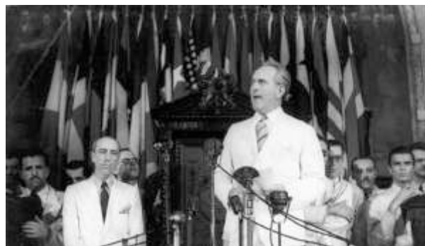
Oswaldo Aranha na ONU, em 30 de novembro de 1947.

A participação marcante do Brasil na ONU foi em 1947, quando o diplomata gaúcho de Alegrete, RS, Oswaldo Arranha, através do voto de minerva aprovou a divisão da Palestina e a criação do Estado de Israel, para a alegria do massacrado povo judeu e ira do mundo árabe.